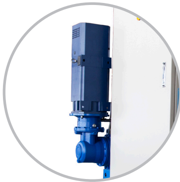
Vertical Motor Detail